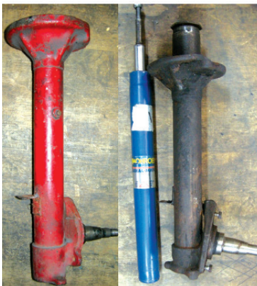
Jambes de force MacPherson / MacPherson struts

A damper that incorporates two adjusters in one mounting eye (as seen on the left but numerous versions exist) will be a monotube damper. To give an idea of scale, the holes in the adjuster wheels on this particular unit are just over 1 mm in diameter.